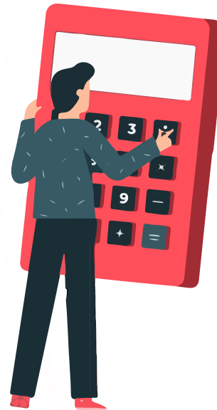
MANEJO DE DEUDAS