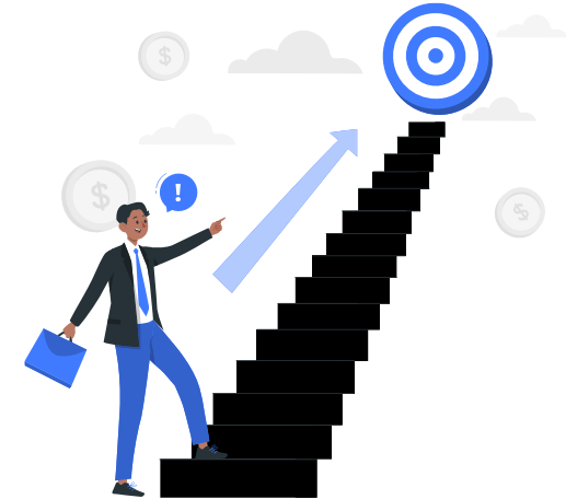
METAS A CORTO PLAZO